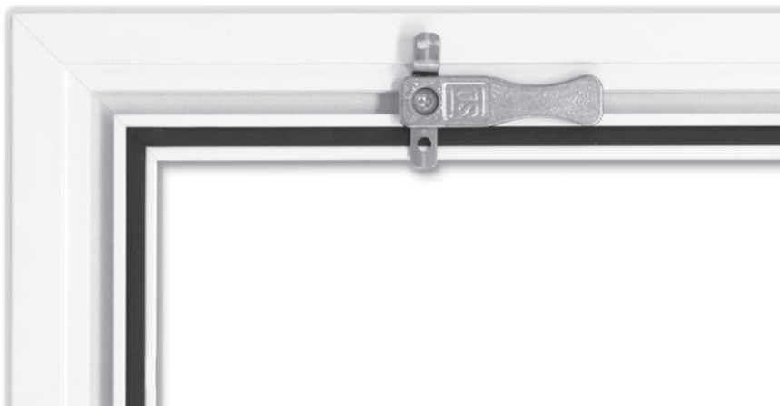
Drehbarer Eihängewinkel oben