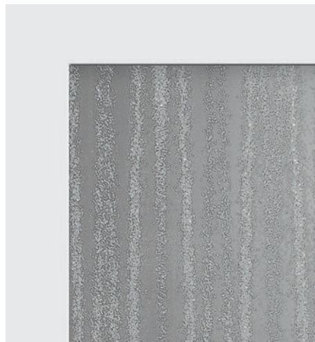
Glas Chinchilla weiß

Kombinieren Sie Ihr individuelles Lieblingsmodell aus unseren Lüttje Lopers mit der Auswahl aus Ornamentgläsern, Griff-Sets in unterschiedlichen Längen aus hochwertigem V2A-Edelstahl und den umfassenden Dekoren (ein- oder beidseitig preisgleich) zu Ihrer persönlichen Traumtür!