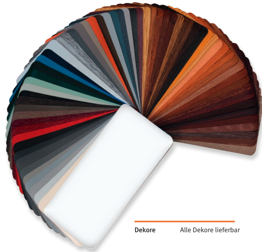
Dekore Alle Dekore lieferbar

Rückseite: Süd 21 Modell 5177-50 Dekor Anthrazitgrau genarbt Glas Satiniertes Glas Griff 400 mm V2A Edelstahl